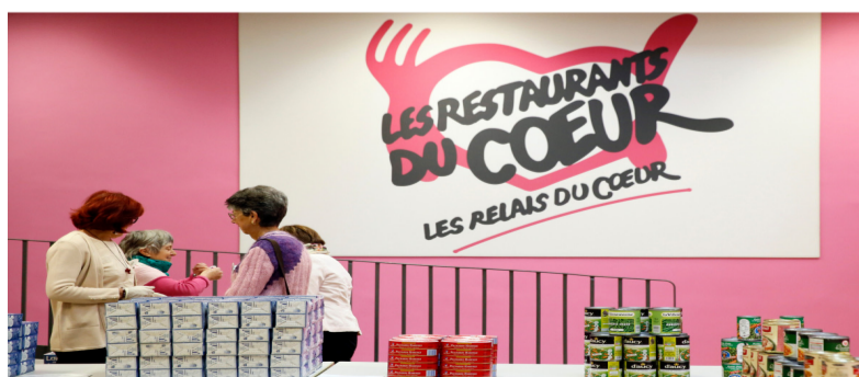
Appel des Restos du Cœur : l'arbre qui cache la forêt